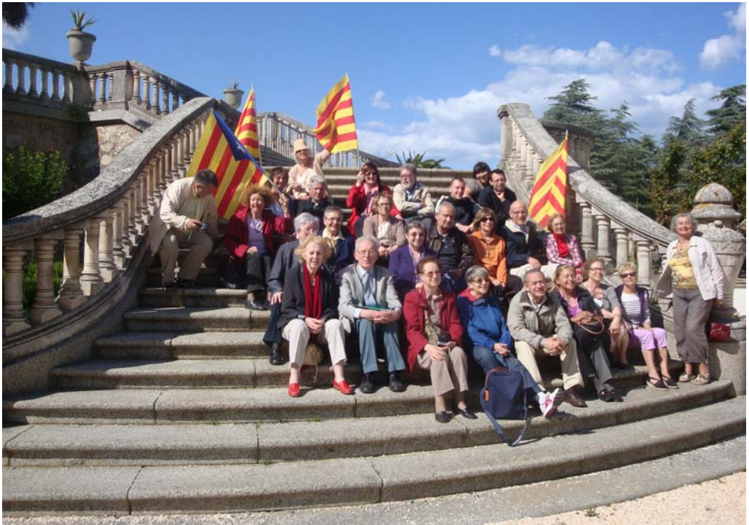
El grup de l'IPECC a les escales del castell de Valmí

INSTITUT DE PROJECCIÓ EXTERIOR DE LA CULTURA CATALANA - IPECC