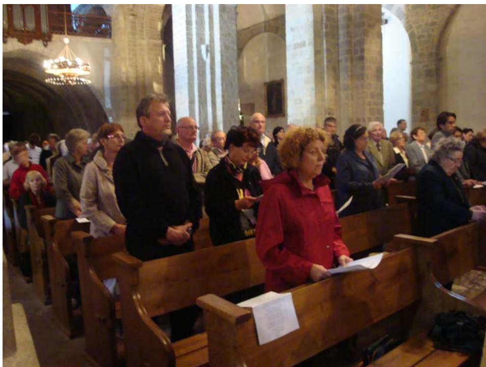
Assistents a la Missa