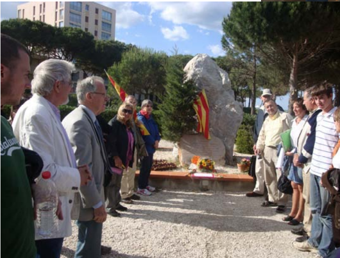
A la platja d'Argelers Monument de record