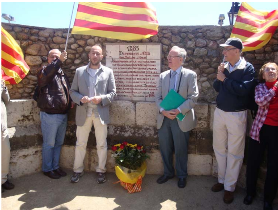
Discursos als jardins exteriors de l'àbsis