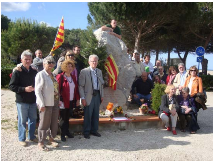
Davant del monument de la platja d'Argelers